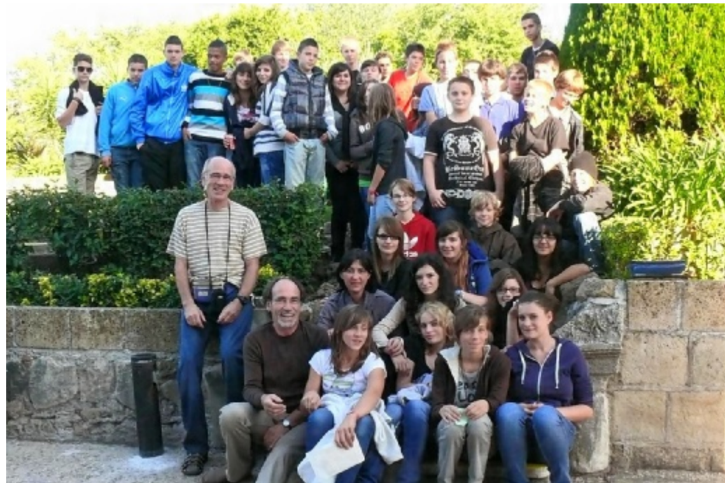
Les élèves de 3 e du collège Berlioz lors de leur séjour romain.

Lundi dernier, rendez-vous était donné à 4 heures sur le parvis du collège. Après la traversée des Alpes suisses et des Apenins, le petit groupe est arrivé à Anzio juste à l'heure pour assister au coucher du soleil sur la plage. Dès le lendemain matin, sur les traces des premiers chrétiens à la suite de saint Pierre et de saint Paul, les visites se sont enchaînées et ont enchanté les uns et les autres : la basilique paléochrétienne Saint-Clément, les catacombes, Saint-Paul hors les murs, Saint-Jean de Latran cathédrale de Rome, la place et la basilique